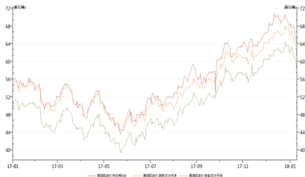
布伦特及环太平洋地区油价现货价格

美国能源信息署(EIA) 2 月 7 日公布的数据显示，截至 2 月 2 日当周，美国原油库存增加 189.5 万桶，市场预估为增加 318.9 万桶。美国精炼油库存增加 392.6 万桶，市场预估为减少 141.9 万桶。美国汽油库存增加 341.4 万桶，市场预估为增加 45.9 万桶。此外，前一周美国国内原油产量增加 33.2 万桶至 1025.1 万桶/日，连续 4 周录得增长。美国产量突破千万桶大关，跳升至创纪录的 1025 万桶/日，创纪录新高的同时已经超过沙特产量水平。庞大的美国原油产量已令原油承压。与此同时，美国原油储备连续第二周增加。随着美国石油产量的增加，人们对市场的担忧正在蔓延，即欧佩克与俄罗斯和其他主要产油国的限制供应的协议可能会面临压力。