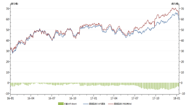
WTI 与 Brent 原油价差